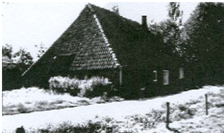
Foto van vroeger